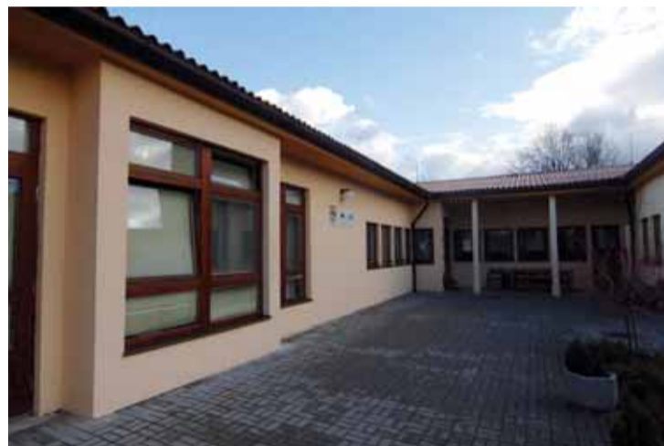
Dětský domov Trnová.

„Delfinek funguje v situacích, kde je třeba pomoci rychle a neodkladně. Když se pak