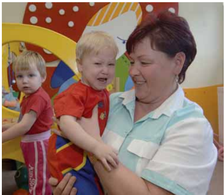
Teta s dětmi z domova.