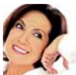
Marie Rottrová, zpěvačka

Vánoce mám ráda už proto, že se sejdeme se všemi svými blízkými. Dělam bramborový salát a rybí polévku. U nás se jí ryba - smažený kapr i kapr načerno. Ale cukroví nepeču a nikdy jsem to ani nezkoušela. Moje maminka pekla excellentní cukroví podle „Santdnery“. Ráda vařím, ráda pečú, ale na rohlíčky nemám trpělivost. Raději vylijú těsto na pekáč a pak ho nakrájím. Vánoční dárky nakupují už od podzimu, když mám čas. Nebaví mě běhat po Praze a účastnit se nákupní horečky.