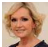
Helena Vondráčková, zpěvačka

Vánoce mám ráda už proto, že se sejdeme se všemi svými blízkými. Dělam bramborový salát a rybí polévku. U nás se jí ryba - smažený kapr i kapr načerno. Ale cukroví nepeču a nikdy jsem to ani nezkoušela. Moje maminka pekla excellentní cukroví podle „Santdnery“. Ráda vařím, ráda pečú, ale na rohlíčky nemám trpělivost. Raději vylijú těsto na pekáč a pak ho nakrájím. Vánoční dárky nakupují už od podzimu, když mám čas. Nebaví mě běhat po Praze a účastnit se nákupní horečky.