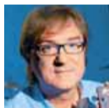
Miroslav Žbirka, zpěvák

Vánoce budu letos trávit v kruhu rodinném s manželem a příbuznými, s naším novým pejskem Elsou. Pro mě jsou Vánoce vždycky příjemností roku, svátky klidu a pohody, kdy navštěvujeme své známé a přátele. Ráda chystám štědrovečerní večeri a vánoční výzdobu nejen celého domu, ale i zahrady. Na mou výzdobu se jezdí dívat procesí lidí i s dětmi. V podstatě chystám výzdobu již od adventu a pokud nemám koncert, zapalují každou neděli jednu adventní svíčku. Pravidelně pečú i vánoční stoly a mám s nimi velký úspěch. Vánoční večere je u nás klasická – rybí polévka, smažený kapr, bramborový salát a každoročně dělám nepečený dort Malakov – naše rodinná tradice. Určitě uděláme u nás doma vše pro to, aby Vánoce byly krásné, klidné. Těším se i na zpívání u vánočního stromku u nás v Řitce. Všem lidem bych popřála, aby ten příští rok byl šťastný a naplněný.