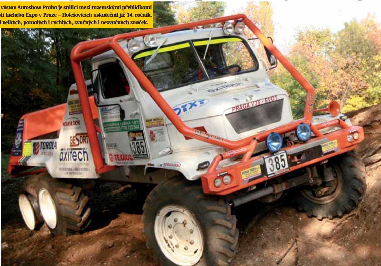
Na Autoshow nebyla k vidění jenom rychlá kola, Lamborghini, Ferrari a Corvette, ale i Praga V3S, karavany a komunální technika.

V oblasti osobních automobilů bylo předvedeno 24 národních premiér a 5 národních premiér v části užitkových vozidel. Mezi osobními automobily největší pozornost poutaly tři zástupci mladoboleslavské automobilky: Škoda Superb, Superb Greenline a zejména nová Škoda Octavia. Rozhodně více než kuriozitou byly čínské vozy Brilliance a Shuanghuan. Svě obdivovatele si našel i modernizovaný Volkswagen Golf, Opel Insignia či Kia Soul. Pozadu nezůstaly ani vozy s pohonem na zemní plyn. Předvedeny byly čtyři novinky. „Mezi exponáty byly i takové speciality jako jsou značky Lamborghini, Ferrari, Corvette,“ připomněl Janouš. Součástí výstavy byl i bohatý dopro-