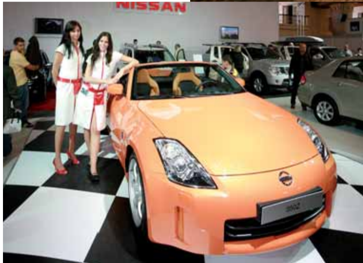
Letošního bloku motoristických výstav na Výstavišti Incheba Expo v Praze se zúčastnilo 105 firem na ploše zhruba 20 000 m 2 .

„Kvalitní audiosoupravy jsou dnes vyžadovány většinou majitelů automobilů. Ne vždy jsou však spokojeni s jejich instalací a funkčností. To, jak si umí pohrát s audiem profesionálové, mohli návštěvníci vidět a slyšet v rámci Mistrovství České republiky v automobilovém ozvučení EMMA CZ,“ sdělil vedoucí Autoshow Janouš. Letošního bloku motoristických výstav se zúčastnilo 105 firem na výstavní ploše zhruba 20 000 m 2 . Příští, 15. ročník, se uskuteční 15. až 18. 10. 2009 opět na Výstavišti Incheba Expo Praha – Holešovice.