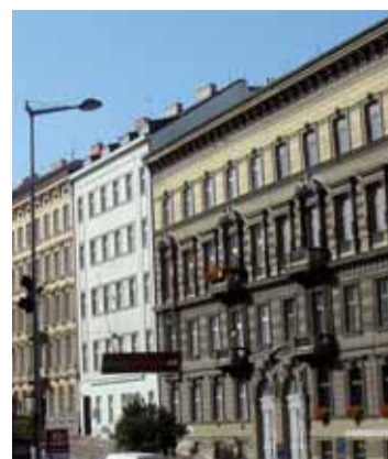
tovická – MČ Bohnice, Tanvaldská a Hrubého – MČ Kobylisy a ulici Krynická – MČ Trója. (kos)

Praha 8 bude privatizovat byty. Odprodej 4 339 bytů posvětila Rada hlavního města. Jde o prodej majetku v celkové ceně 744 365 900 korun. „Vzhledem k výši částky prodáváného majetku musela podle statutu hlavního města Rada schválit tento záměr. V tomto případě jde o prodej čtyř panelových domů s 1 272 byty,“ vysvětlil radní Janeček, který návrh předkládal. Městská část Praha 8 plánuje celkem odprodej 4 339 bytů ve třech kolech. První z nich proběhne ještě v letošním roce, další dvě by se měly uskutečnit v roce 2009. Ve schváleném návrhu jde o prodej obytných domů v ulicích Ka-