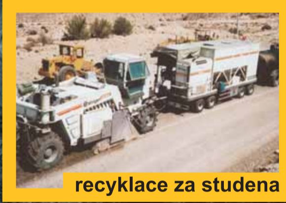
recyklace za studena