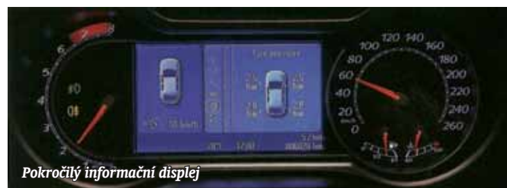
Pokročilý informační displej