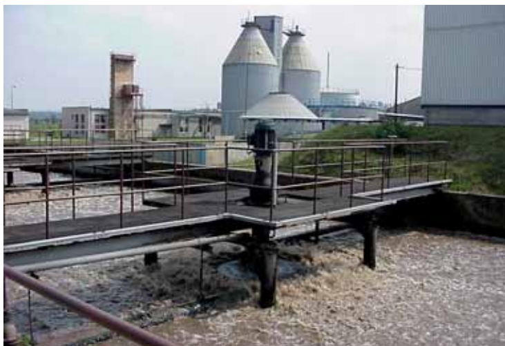
Čistička odpadních vod Louny

Letos SVS v Ústeckém kraji zahajuje realizaci jednotlivých staveb projektu Dolní Labe, který je v celkovém objemu zhruba 600 milionů korun.