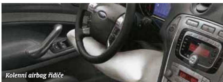
Kolenní airbag řidiče

Text: Václav Sedlák