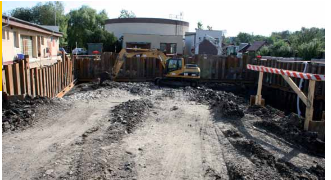
Probíhající rekonstrukce čistírny odpadních vod v Podbořanech.