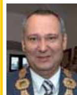
Pavel Růdl, primátor města Plzně

Je to jenom dobře, když se objeví na novinovém trhu další nový titul. Občanům se rozšíří nabídka, protože každý vydavatel, každý tým, který noviny tvoří, má vždy jinou představu o tom, jak by měly vypadat. A tahle pestrost je potřeba. Dejme lidem možnost výběru, co si přečíst. Myslím si, že dnes je bohužel trend zveřejňovat pouze negativní zprávy, vyděsit čtenáře, a tak je dobré, že Západočeský Metropol touto cestou nejde. Jde o noviny pozitivního typu, a to je dobře. Ani já už nechci stále dokola číst jen negativní informace. Popřál bych mu přízeň čtenářů a také, aby na trhu vydržel.