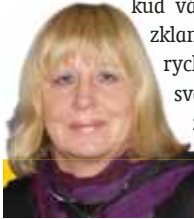
Sestavila: Ludmila Petříková

Panna 24. 8. - 23. 9. Pro lidi, kteří jsou vám blízcí, děláte v případě potřeby víc, než si dokážete zdůvodnit sami před sebou. Pokud vás ovšem partner zklame, jste schopni rychle zrušit pevný svazek. Nebojte se změny.