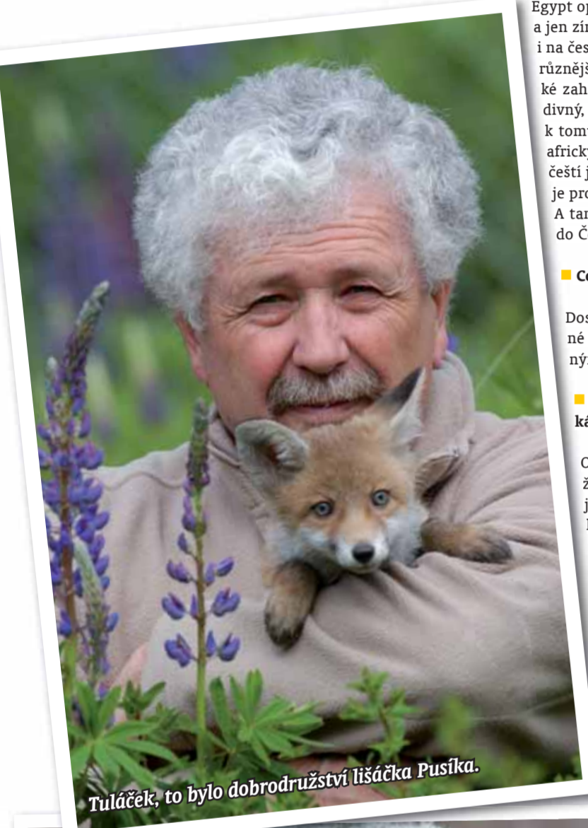
Tuláček, to bylo dobrodružství lišáčka Pusíka.