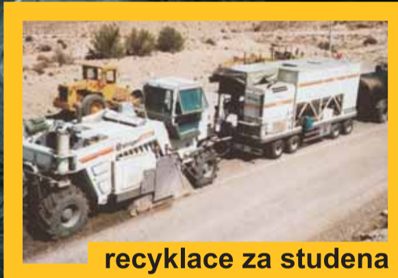
recyklace za studena