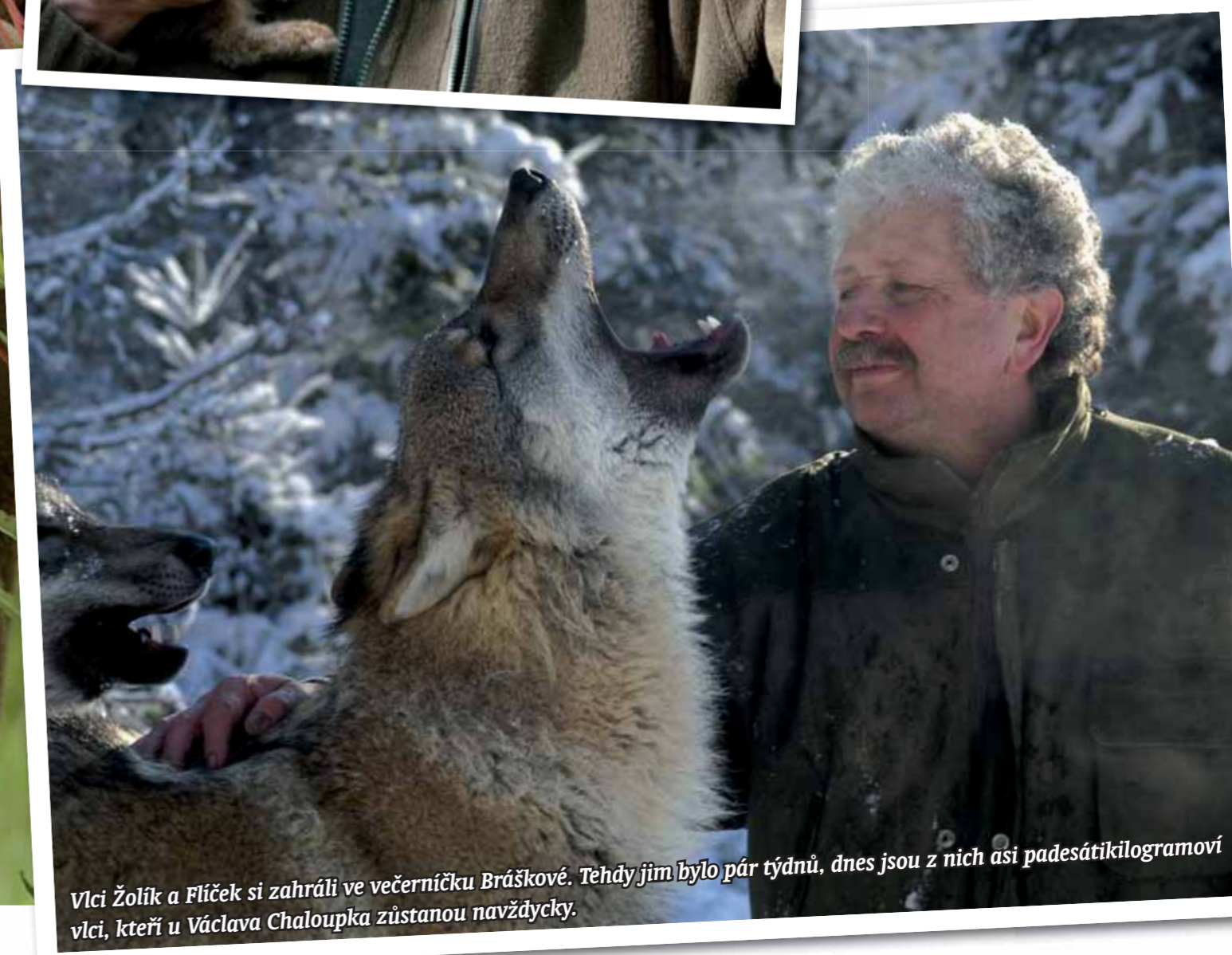
Vlci Žolík a Flíček si zahráli ve večerníku Bráškové. Tehdy jim bylo pár týdnů, dnes jsou z nich asi padesátikilogramoví vlci, kteří u Václava Chaloupka zůstanou navždycky.